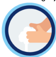
Was je handen regelmatig

Daarnaast mogen kinderen geen voedsel met elkaar delen. Trakteren mag, maar alleen fabrieksmatig verpakte traktaties of een niet eetbare traktatie. De kinderen gaan niet met hun verjaardagskaart de klassen rond om meesters en juffen te trakteren.