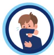
Hoest en nies in de binnenkant van je elleboog