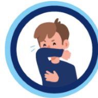
Hoest en nies in de binnenkant van je elleboog