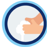
Was je handen regelmatig

Daarnaast mogen kinderen geen voedsel met elkaar delen. Trakteren mag, maar alleen fabrieksmatig verpakte of niet eetbare traktaties. De kinderen gaan niet met hun verjaardagskaart de klassen rond om meesters en juffen te trakteren.