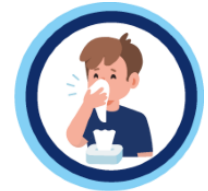
Gebruik papieren zakdoekjes en gooi deze weg